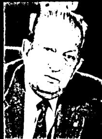
Vicente Botta O mais antigo deputado da Assembléia de São Paulo, em seu 10º mandato