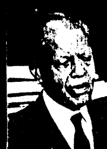
Nelson Carneiro O veterano senador que é um campeão de projetos no Congresso Nacional