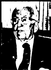
Juracy Magalhães O último representante de uma geração de rebeldes fardados da Revolução de 30