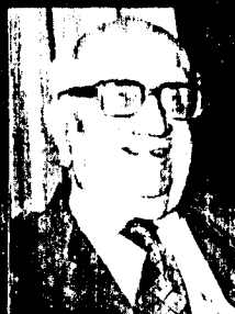
Barbosa Lima Sobrinho O político e jornalista de muitas lutas pela cidadania, que preside a ABJ