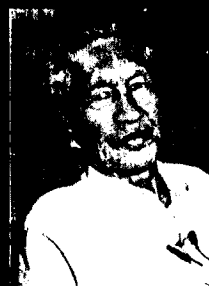
Francisco Julião O ex-deputado pernambucano que agitou o Brasil nos anos 60 com as ligas camponesas