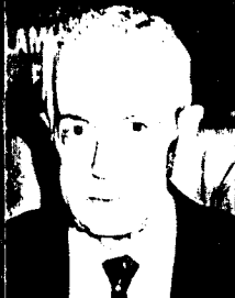
Laudo Natel O menino pobre do interior que se elegeu duas vezes governador de São Paulo