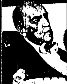
Oscar Niemeyer O brilhante arquiteto que, ao lado de Juscelino, construiu Brasília