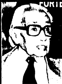
João Amazonas O velho líder comunista, de muitas andanças e também muitas conspirações