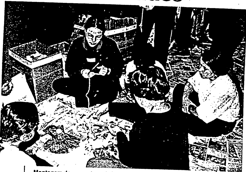
Montagem de maquetes e brinquedos, com sucata