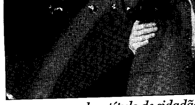
CAETANO recebeu título de cidadão

O artista plástico Edu das Águas fez um quadro de Caetano Veloso, durante o espetáculo. "Sou um dos últimos sobreviventes dos pintores que trabalham enquanto acontece o fato. A maioria dos meus colegas só pinta em estúdio", comentou ele, que já retratou vários outros artistas em cena.