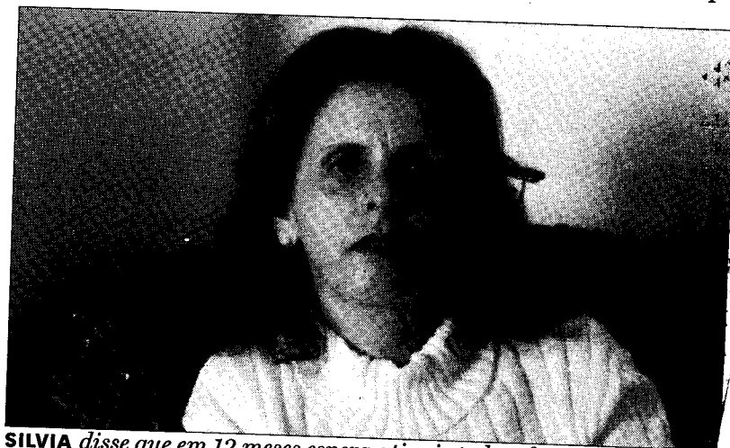
SÍLVIA disse que em 12 meses espera atingir todo o funcionalismo