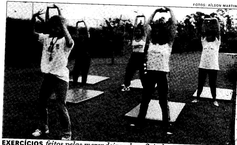
EXERCÍCIOS feitos pelas merendeiras, beneficiadas na primeira etapa