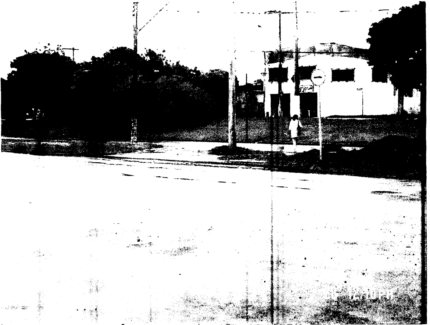
Avenida América do Sul