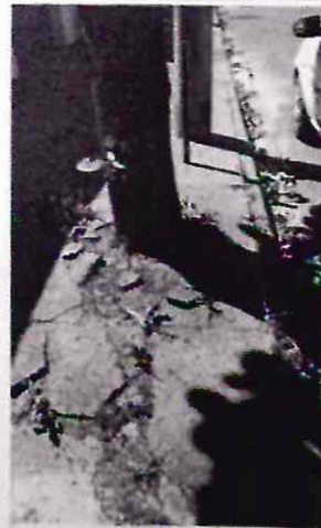
Foto - 3 - Notam-se galhos que interferem na fiação elétrica particular devido a dimensão da copa. Foto - 4 - Algumas fissuras foram observadas no calçamento de entorno, agravada pelo canteiro que apresenta tamanho inferior ao recomendado (1,0m x 1,0m).