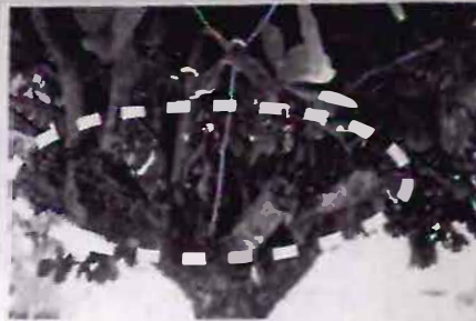
Foto - 1 - Vista geral e dimensões do indivíduo arbóreo identificado "Chapéu de praia" - Terminalia catappa plantado próximo ao poste. Foto - 2 - Mostra região de galhos que sofreram históricas podas drásticas.