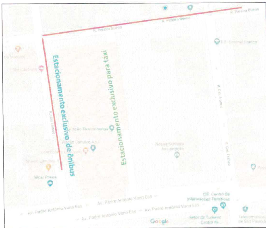
Figura 2 - linha vermelha trajeto de ônibus - Sugestão

Entre outros itens, que são o trecho do estacionamento está sem calçada, quando chove vira um lamaçal, o ruído constante que atrapalham as duas escolas aqui localizadas, impedem também veículos destinados a socorro de incêndio e salvamento, obstruindo a via de trânsito para trafego de ambulâncias.