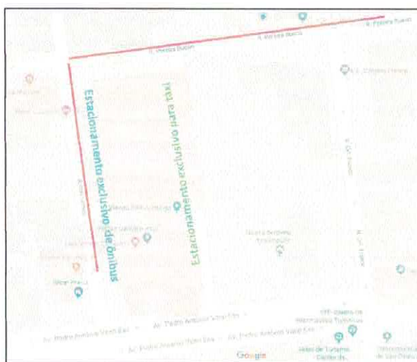
Figura 3 - Logística sugerida