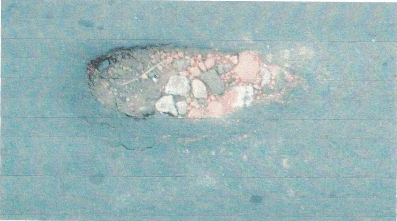
Buracos Rua Santo Antonio, Vila Brás