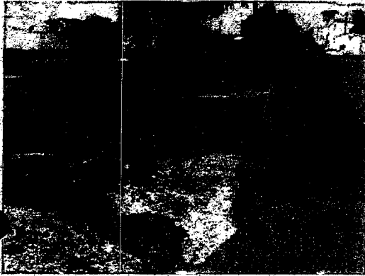
IMG_3770.JPG ~2,8 MB