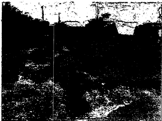
IMG_3771.JPG ~2,8 MB

00431-Caixa Pirassununga-08/04/2016-09:48:29781448295820 2