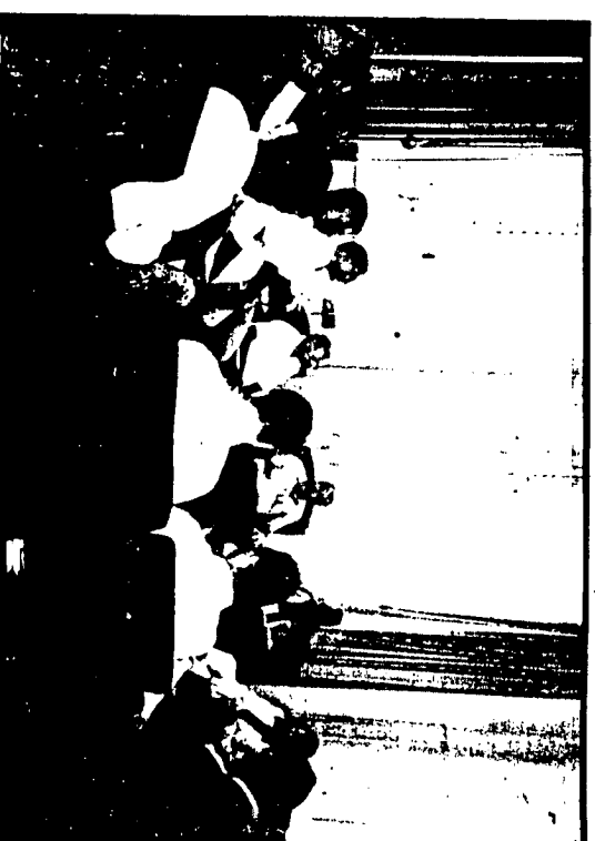
A foto é uma panorâmica da reunião realizada dia 14.