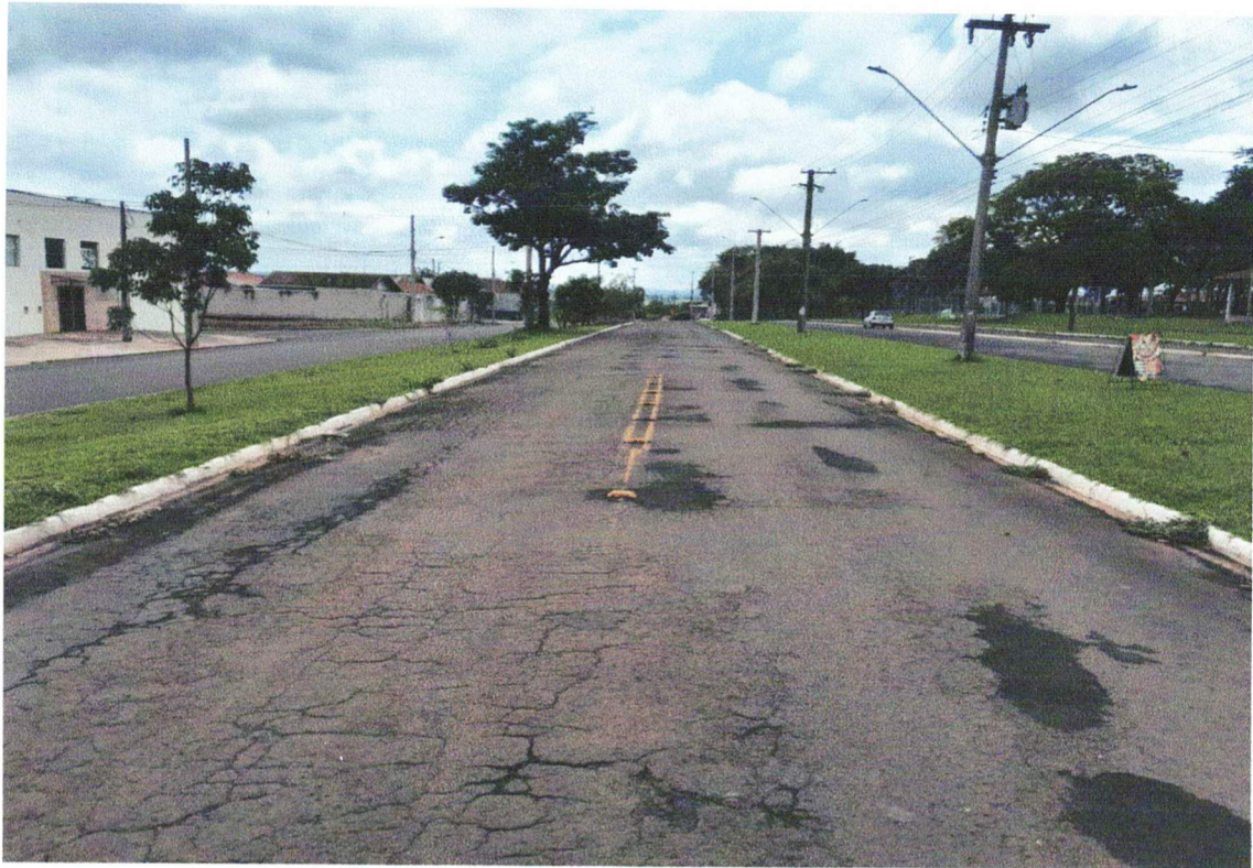
Avenida: Duque de Caxias Norte