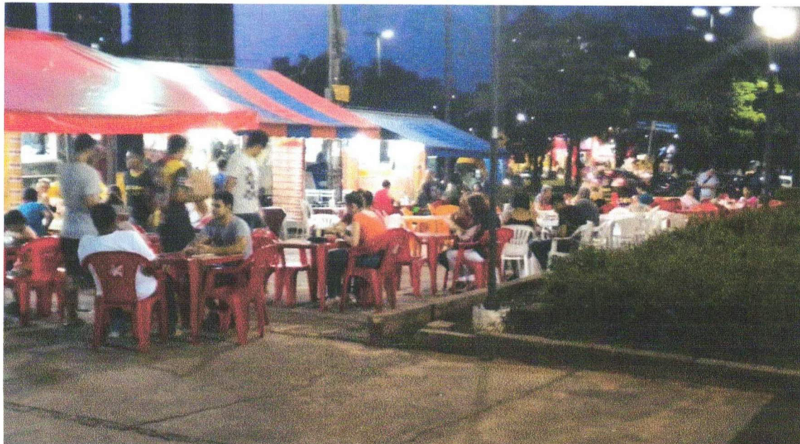
Exemplo Praça de Alimentação com Food Truks