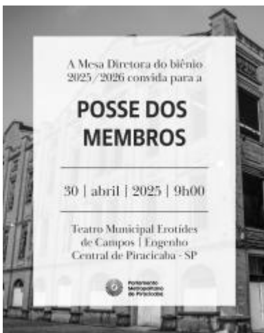
POSSE -PARLAMENTO METROPOLITANO DE PIRACICABA (1).jpeg ~334 KB