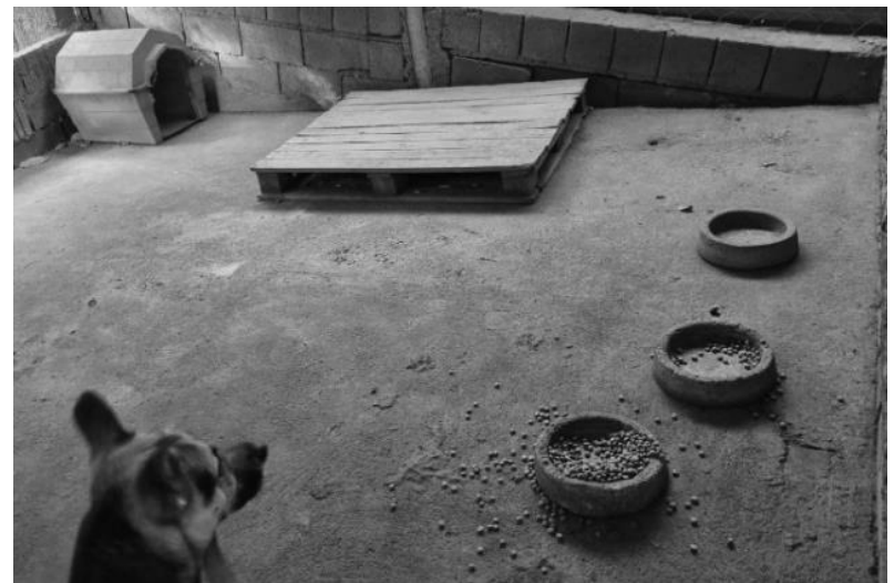
Figuras 1-3: Animal com score de magro a caquético. Arcada dentária com falhas e dentes tortos e podres. Aspecto da baia.